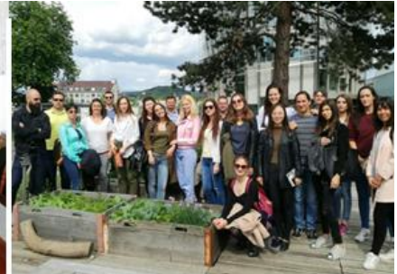
TU Wien / TU Belgrad, Study Tour