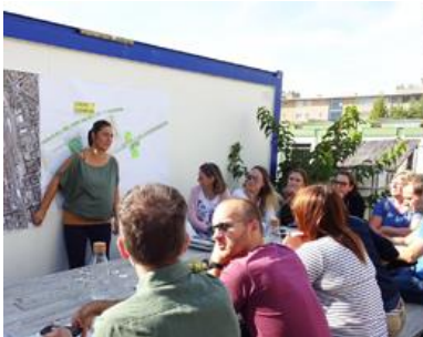
Standortentwicklung WSE, Wien

Delegationen und Besuche vor.ort 2018: Bustour der Wirtschaftsabteilung „Go West“, TU Wien und TU Belgrad / TU Graz, Institut für Wohnbau / TU Graz + Joanneum (Ausstellung) / Wiener Standortentwicklung GmbH, WSE / IUC International Cooperation EU-Latin America, Kolumbien / Urban Innovation Vienna / Uni Graz, Lehramt Geografie, Seminar "Stadt und Digitalisierung" etc.