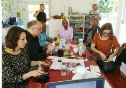
IUC International Cooperation, Kolumbien