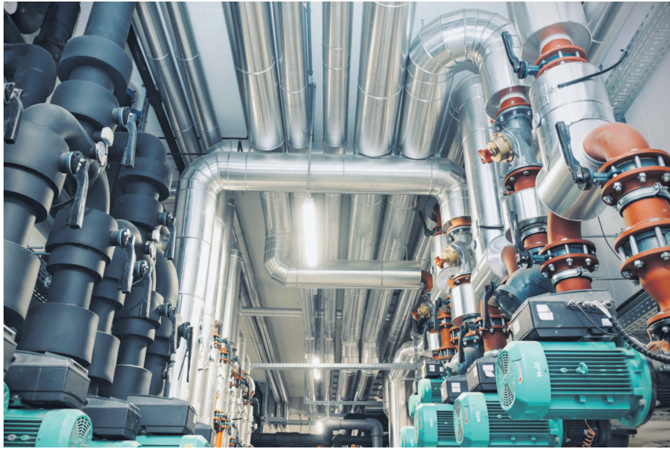
Aus allen Rohren. Unterirdische Lebensadern versorgen das Baufeld Mitte in der Smart City mit klimafreundlicher Energie.